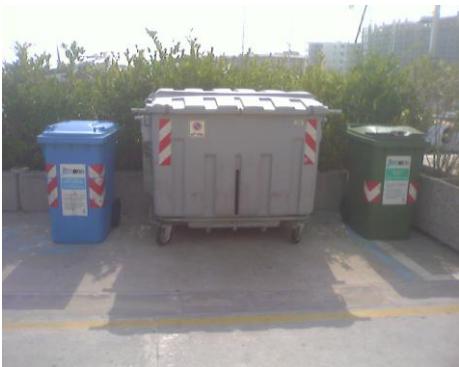
Contenitori vetro cartone indifferenziato

Tali contenitori verranno dislocati in gruppi da quattro (carta, vetro, plastica e indifferenziato).